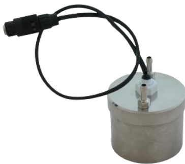
Abbildung 2: Edelstahlbehälter des Wassereintrittsschutzes

Wenn das Gerät zur Messung von Radon in der Luft verwendet wird, muss der mitgelieferte lose Stecker eingesteckt werden, anstatt den speziellen Edelstahlbehälter anzuschließen. Andernfalls würde die eingebaute Pumpe keine Luft mehr ansaugen.